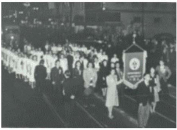
写真: 1941年CYBL会議、イースト ファースト ストリート沿いの市庁舎へのパレード

この会議には、過去の約200人に比べて800人以上の参加者があり、参加者の大幅な増加が見られました。CYBLとの集会で、「北米青年仏教徒連盟」と呼ばれる若い仏教徒のための全国連盟が設立されました。最初の理事はシアトルのはらだ まさる理事長。ペーカースフィールドのヘンリー ミワ、副理事長。秘書アラメダのたかき よしえ。サクラメントのウィリアム テラモ